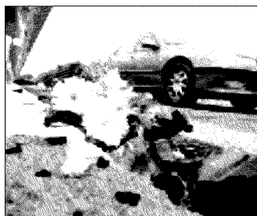
DEL PORTO, REGGIO e SANNINO ALLE PAGINE 10 e 11