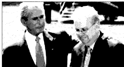
George W. Bush con Karl Rove